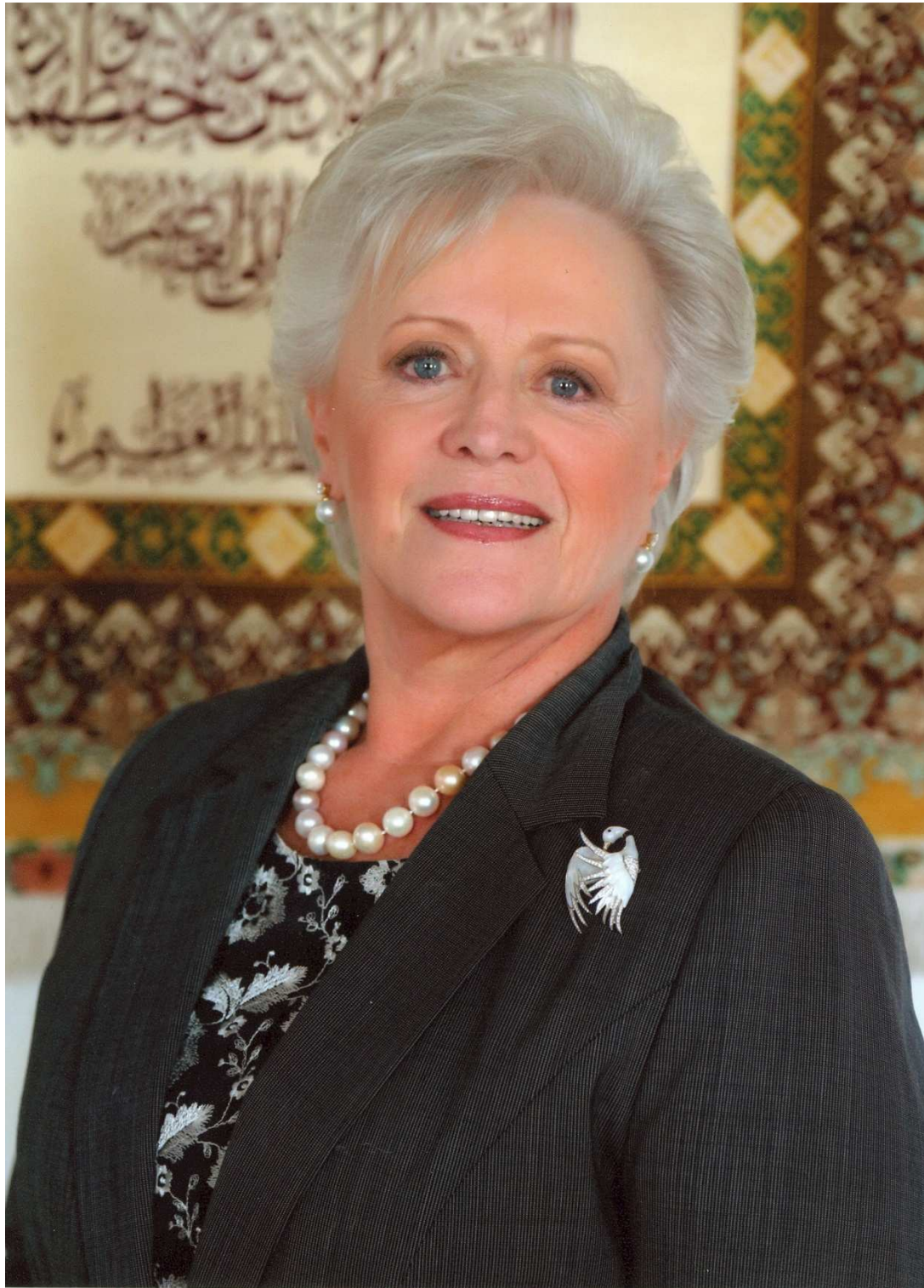
Her Royal Highness Princess MUNA AL-HUSSEIN of the Hashemite Kingdom of Jordan