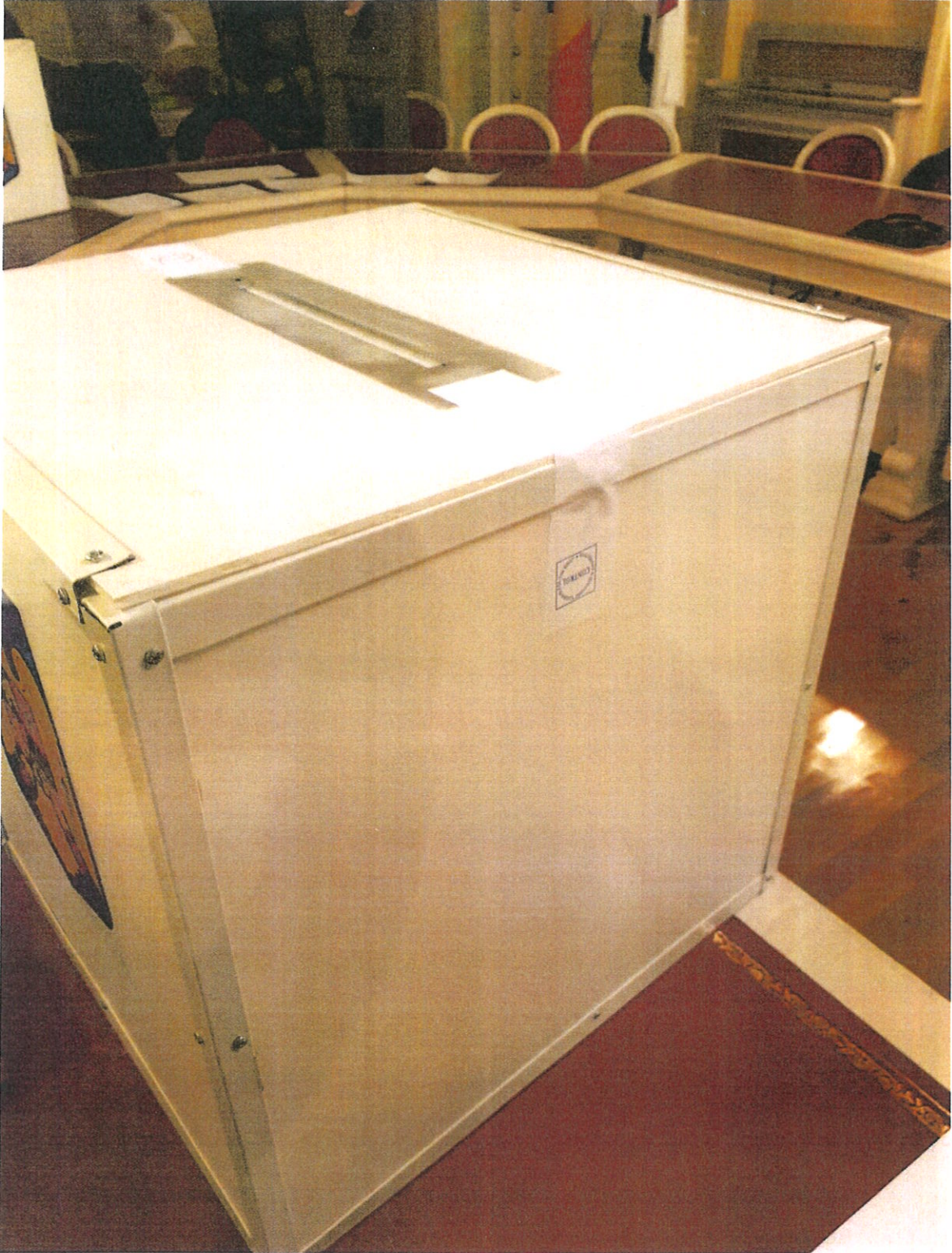
URNA ALOCATĂ SECȚIEI DE VOTARE NR. 3