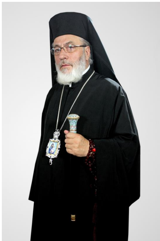
ÎNALTPREASFINȚITUL PĂRINTE CALINIC ARGEȘEANUL ARHIEPISCOP AL ARGEȘULUI ȘI MUSCELULUI